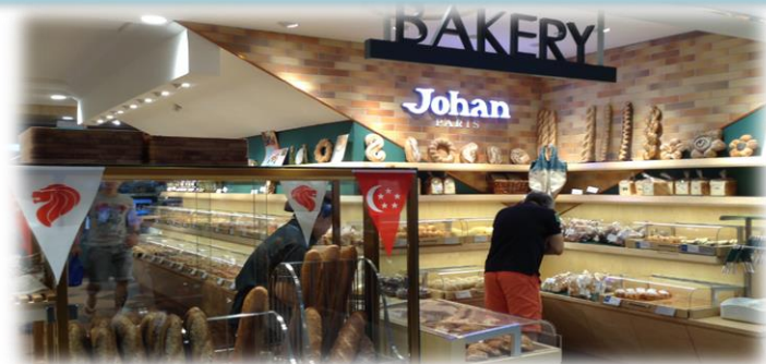
シンガポール伊勢丹 ジュロン イースト店