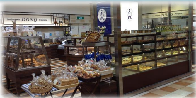
ドンク シンガポール高島屋店

創業明治38年から続く老舗ベーカリーで、日本で初めて本格的なフランスパンの製造・販売に取り組んだことでも知られています。 シンガポールでは「DONQ」「Johan」「Mini One」の3つのブランドを展開されており、世界中でフランスパンの販売を手がけ、日本で、世界でお客さまに選ばれるベーカリーを目指されています。