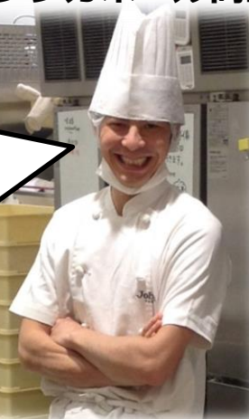
DONQの味をささえるパン職人